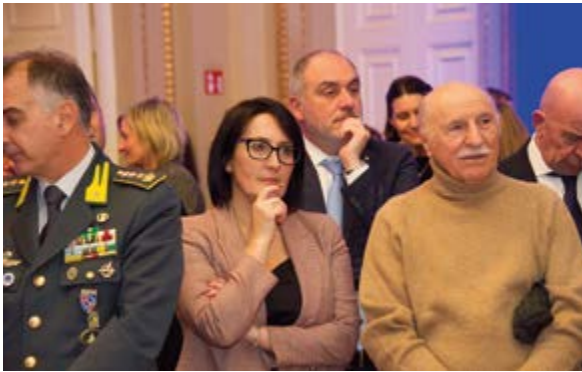
Sopra in primo piano in Sala Ressi durante le celebrazioni dei 50 anni: Emma Petitti Presidente dell'Assemblea legislativa dell'Emilia-Romagna. A destra Dario Costantini Presidente nazionale di CNA