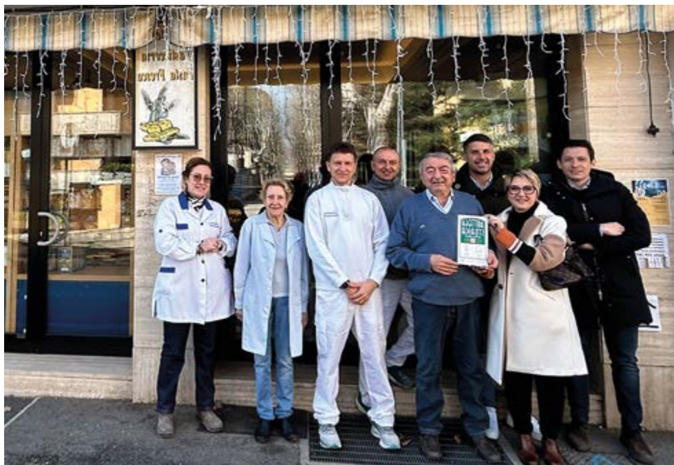
La consegna ufficiale della targa di “bottega storica” assegnata al panificio Tirincanti.