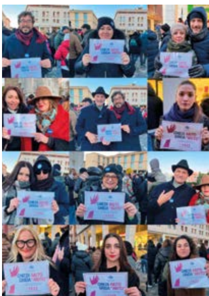
Nella foto imprenditrici, imprenditori e staff CNA Rimini.

In occasione del 25 novembre, giornata internazionale contro la violenza sulle donne, CNA Impresa Donna e CNA Rimini hanno portato ancora una volta l'attenzione sul fenomeno della violenza di genere. Una folta delegazione CNA ha partecipato alla manifestazione sfilando per il centro e ribadendo la propria ferma opposizione ad ogni tipo di discriminazione o violenza di genere.