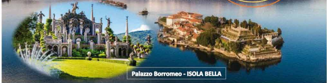
Palazzo Borromeo - ISOLA BELLA