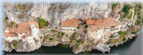
EREMO SANTA CATERINA DEL SASSO