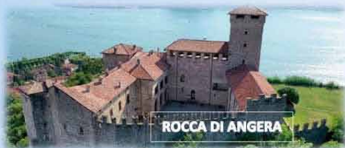
ROCCA DI ANGERA